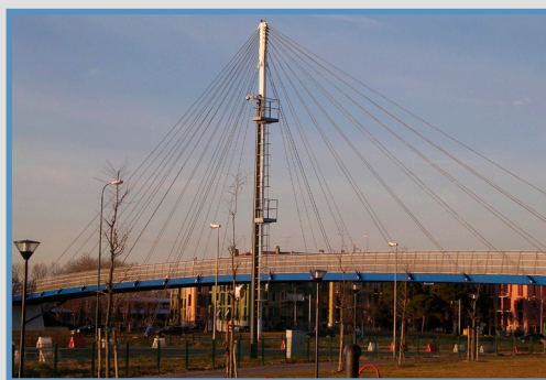
Ponte di San Giuliano