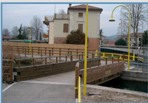
Ponte su un canale